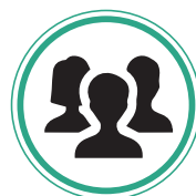
COMITÉS DE USUARIOS