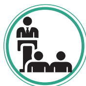
RENDICIÓN DE CUENTAS